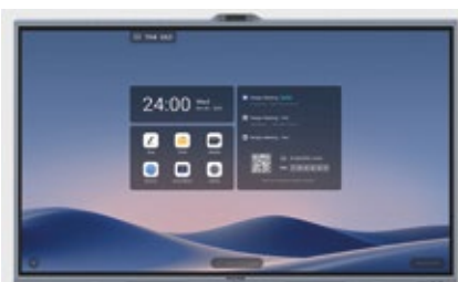
Funzionalità LIM Videoconferenza