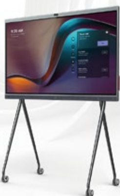
Funzionalità LIM Videoconferenza